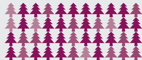
440 Hektar Wald entsprechen

➤ 2017 blieben dem Klima durch unser Engagement 4.399 Tonnen des Klimagases Kohlendioxid erspart. Das entspricht 2.173 stillgelegten Autos, 440 Hektar Waldgebiet, rund 616 Fußballfeldern oder dem CO 2 -Fußabdruck von 483 Deutschen.